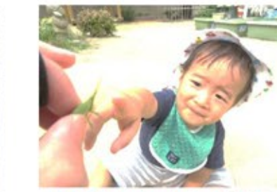
バッタさんこんにちは(いちご組)