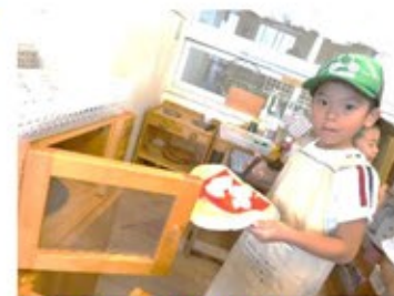
ひまわり組のピザ屋さんがオープンしました(ひまわり組)