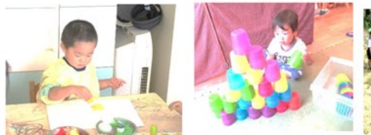
はたはたスタンプ遊び(ぶどう組) 高く積んでいるよ!(もも組)