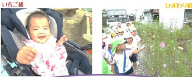
いちご組 お散歩が楽しい季節になったね