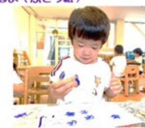
編ったお芋で芋スタンプ遊び(さくら組)