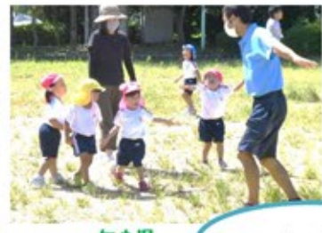
年少児 体育あそび