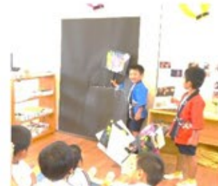
すみれ組では花火大会が行われていましたよ(すみれ組)