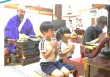
お寺での月詣り(すみれ組)