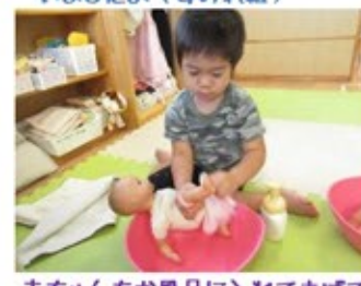
赤ちゃんをお風呂に入れてあげていましたよ(ぶどう組)